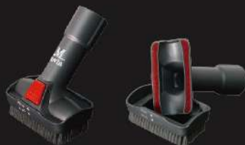
二合一吸頭 毛刷吸頭/平面吸頭