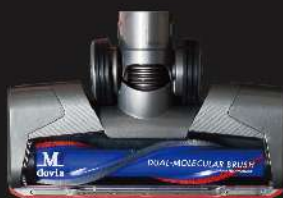
雙材質滾刷地板吸頭