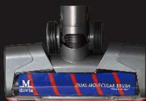
絨毛滾刷地板吸頭 (選購)