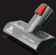
除蟎滾刷吸頭 (選購)